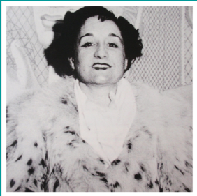
Maruja Mallo Lugo.1902. Madrid 1995