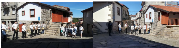
7. IES Ferro Couselo “Debate sobre o “cartel” da película