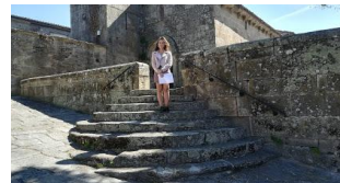
10. IES Allariz. Vídeo presentación de Manuel Rivas