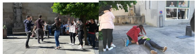
8. IES Blanco Amor: “Recita un poema. Escena do inferno”