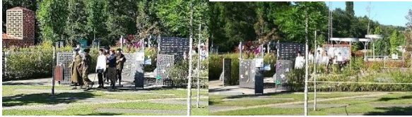
3. IES Bande: Discurso sobre a importancia dos Mestres