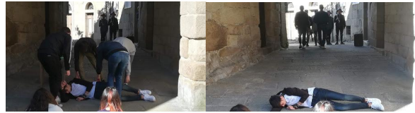
4. IES Celanova. Retrato de Rivas de neno.