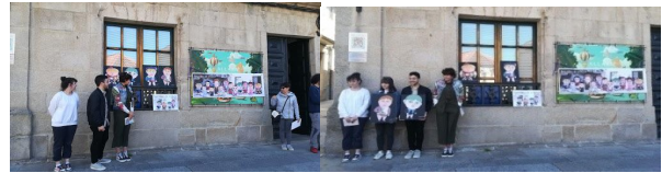
6. IES Viana do Bolo. Representación mímica da Morte dun