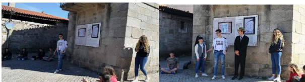
9. IES Cidade de Antioquía: “Retrato da chinesa”