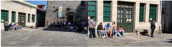
5. IES Allariz. Interpretación “Orquestra Azul”