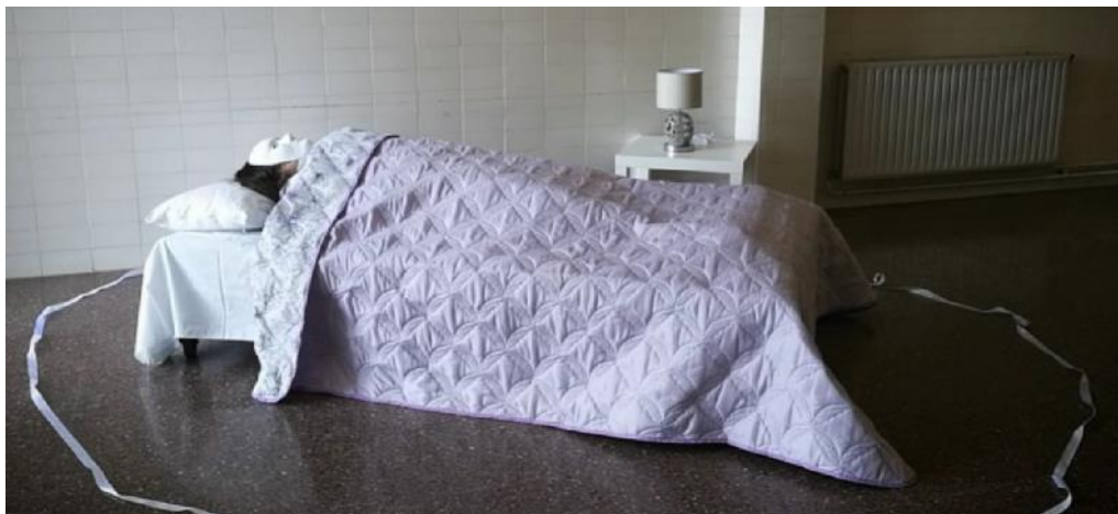
“Pis”, de Olga Novo