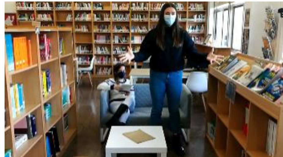
“Aprendizaxe”, de Olga Novo, en linguaxe de signos