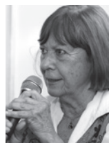
1982 | ESCRITORA Lygia Bojunga