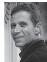
2011 | ILUSTRADOR Roger Mello