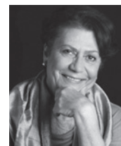
2000 | ESCRITORA Ana Maria Machado