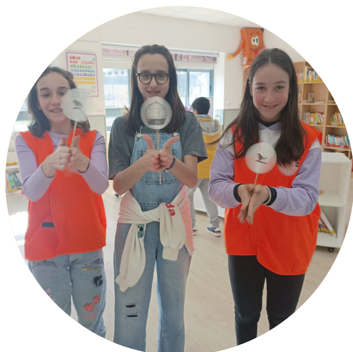
Bibliocolaboradores Alumnado 5º e 6º