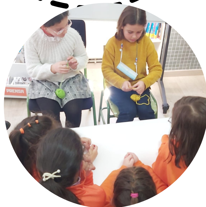
AventurínClub Compartindo Saberes Comunidade Educativa