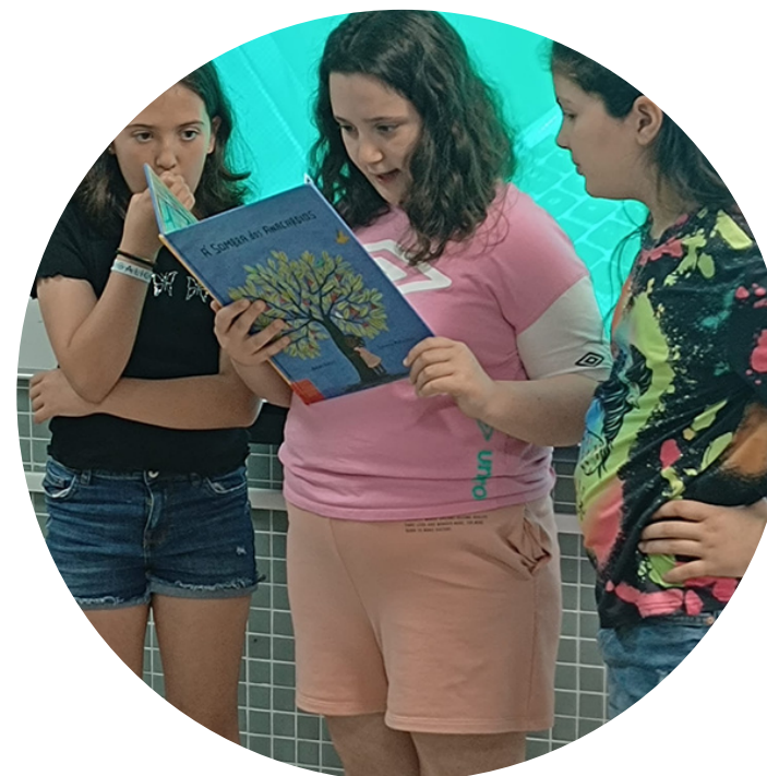
AventurínClub Compartindo Lecturas Comunidade Educativa