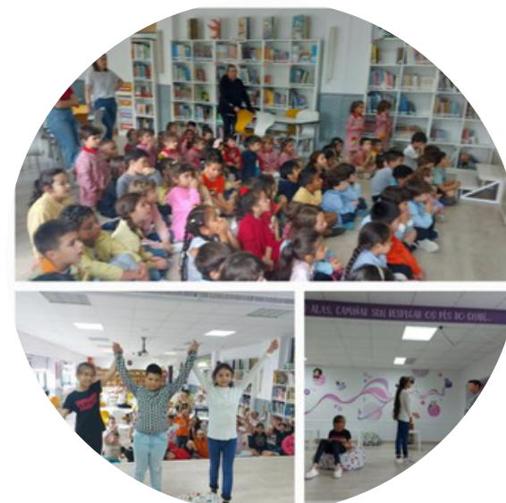
Os venres ...un conto