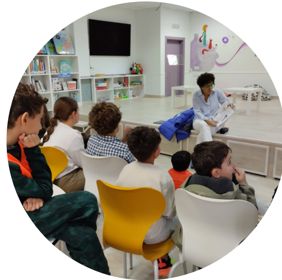
Os venres ...un conto