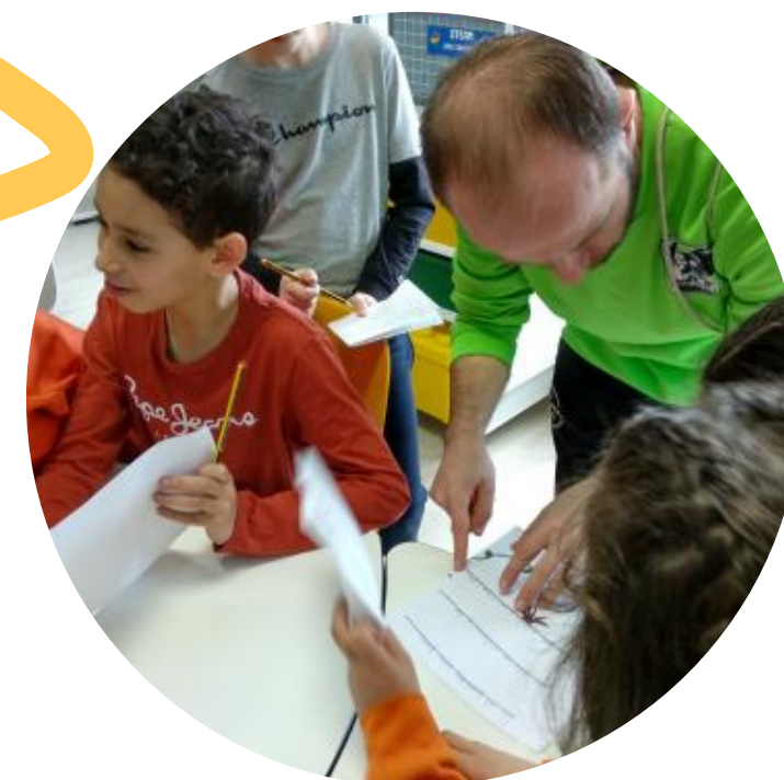
Persoal non docente e Profesorado Pluricolaboración