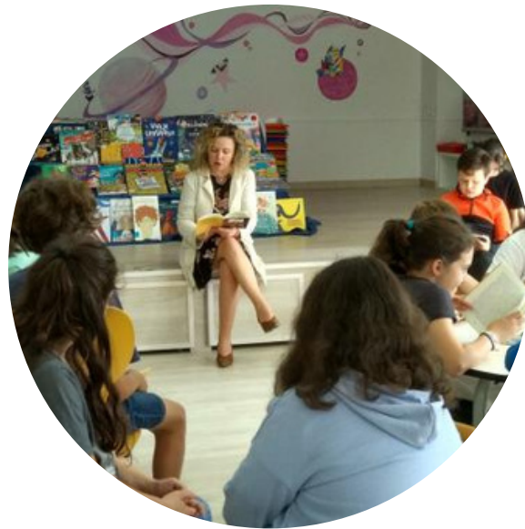
Lecturas compartidas ( Club Lectura )