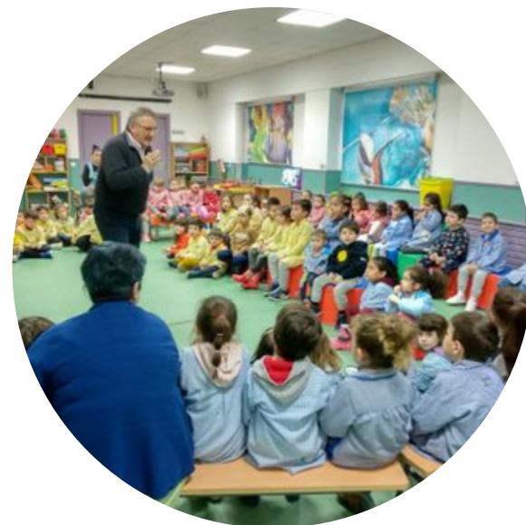
Os venres ...un conto