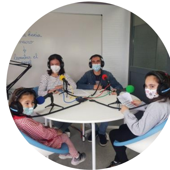
Contos na radio Contos de Boas Noites