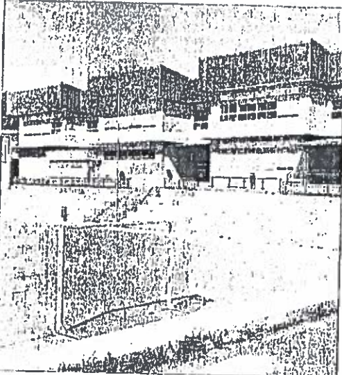
El colegio de San Roque ya tiene nuevos ventanales.

Educación destinó alrededor de 100.000 euros procedentes de fondos europeos a la reforma integral del colegio de San Roque, donde ejecutó desde el pasado verano un proyecto de "eficiencia energética" que incluyó el cambio de puertas y ventanas, falsos techos y luminarias para sustituidas por estructuras más estancas y luces de tecnología led, que consumen mucho menos. Técnicos contratados por la Xunta elaboraron el proyecto de ejecución y las obras finalizaron a principios de este año, según confirmaron sus responsables.