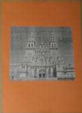
CATEDRAL DE SANTIAGO

DESCRIPCION La Catedral de Santiago de Chile es un templo católico que se encuentra en la ciudad de Santiago, Chile. Fue fundada en 1541 por el obispo Juan de San Martín y fue reconstruida en el siglo XVIII por el arquitecto Juan de Cruz. DESCRIPCION El templo es un ejemplo de la arquitectura barroca chilena. Está construido en piedra y tiene una fachada con dos torres que sirven como campanarios. El interior está decorado con pinturas y estatuas.