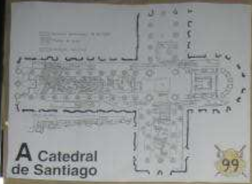
A Catedral de Santiago