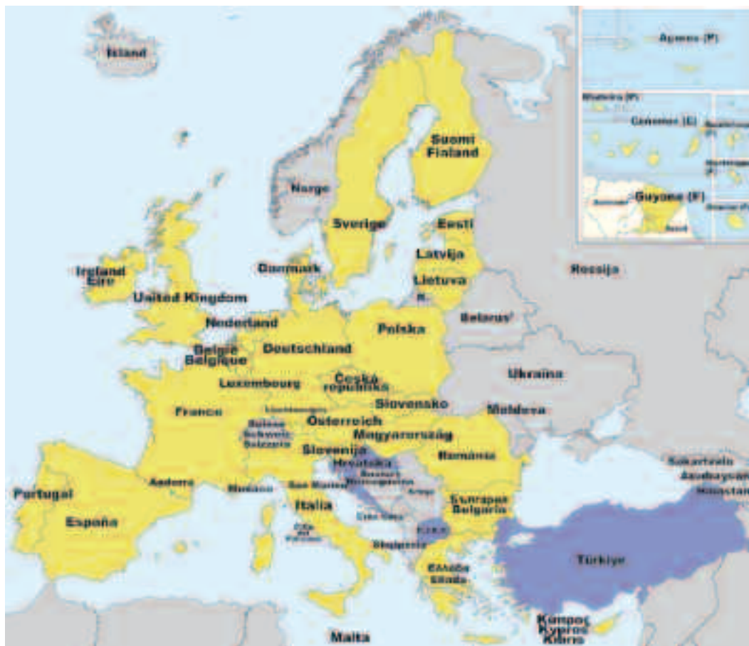
Países da Unión Europea. Editor: Comisión Europea