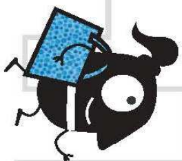
Sesión de meditación