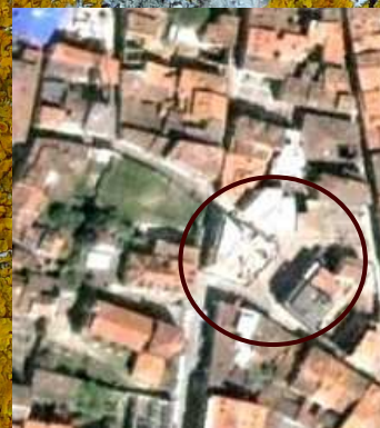
PRAZA DOS ZAPATOS: Pegada a anterior.