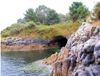
Fotografías dispoñibles nas galerías fotográficas do Portal de Contidos, de libre disposición para uso educativo.