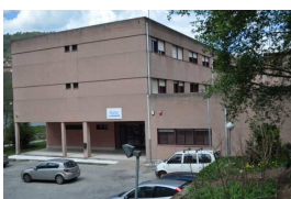
IES As Barxas (Moaña)