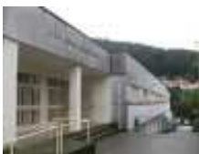
IES Johan Carballeira (Bueu)