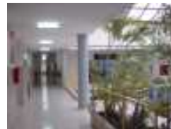
IES María Soliño (Cangas)