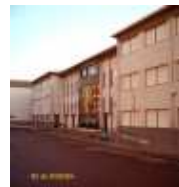
IES de Rodeira (Cangas)