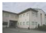
IES Illa de Ons (Bueu)