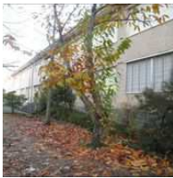
IES Monte Carrasco (Cangas)