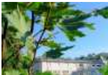
CPI do Toural (Vilaboa)