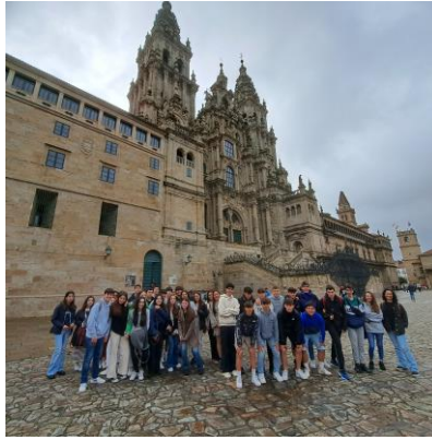
Na Praza do Obradoiro