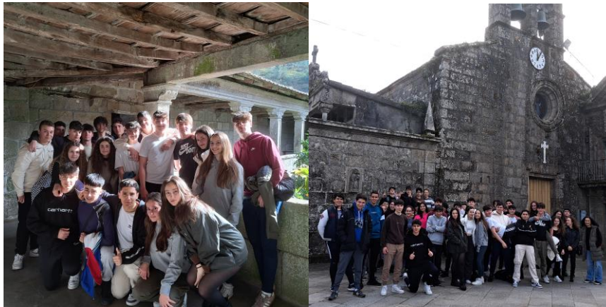
No Mosteiro de San Pedro de Tenorio