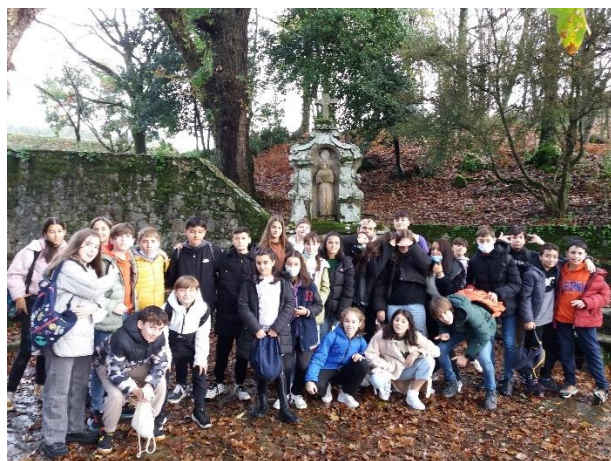
Fonte de San Francisco no Convento de Herbón