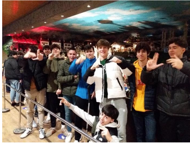
O noso alumnado no Belén