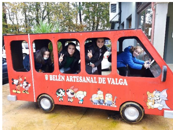
Exterior do Belén