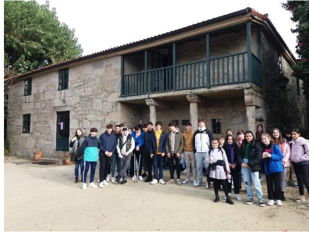
Na fachada da Casa-museo de Rosalía de Castro