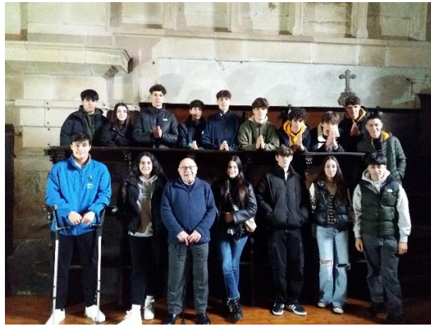
Alumnado co gardián do Convento de Herbón