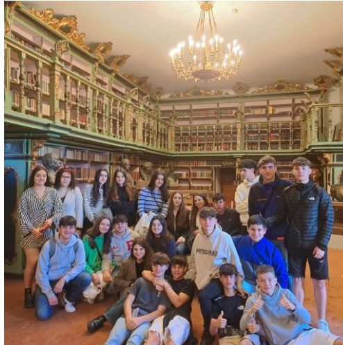
Biblioteca América (visita ao Patrimonio da USC)