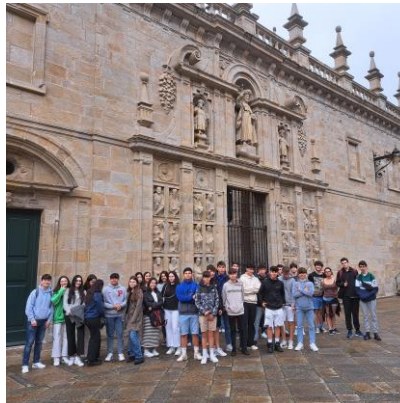
4º da ESO diante da Porta Santa