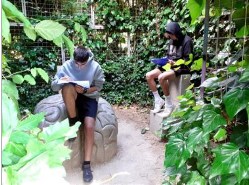
Plan Proxecta: Paisaxe e sustentabilidade. Actividade colaborativa co Departamento de Bioloxía. Alumnado de 3o de ESO