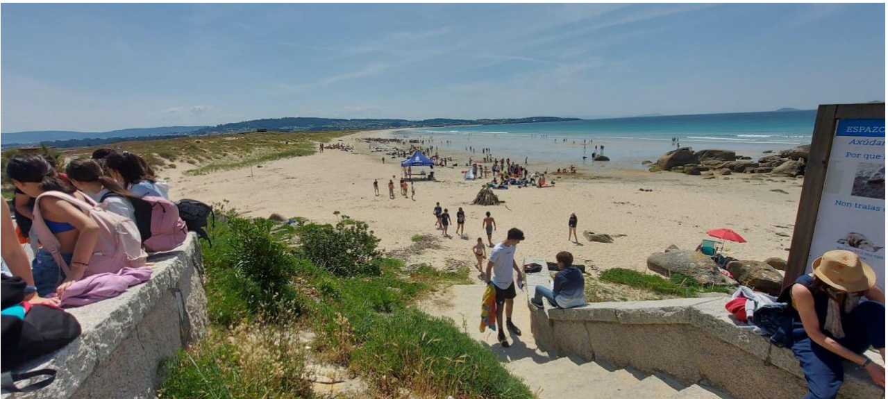
Deseño para o 17 de maio.