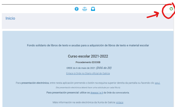
pantalla inicio FONDO LIBROS

Se dispón de CHAVE 365 pode facer cómodamente de xeito telemático a solicitude de FONDO LIBROS .