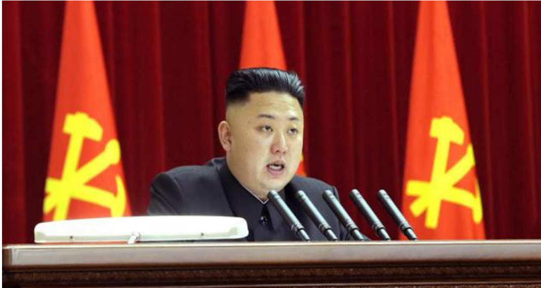
El líder de Corea del Norte Kim Jong-un.

El ejército de Corea del Norte ha recibido la aprobación definitiva para el posible ataque a Estados Unidos. Corea del Norte informa oficialmente a la Casa Blanca de que usará "medios nucleares de alta tecnología más pequeños, ligeros y diversos".