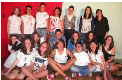
Grupo "Los Pocholiños".

A estos actores los fueron a animar gran parte de los alumnos de su instituto junto a algunos profesores que disfrutaron de una agradable tarde en el teatro.