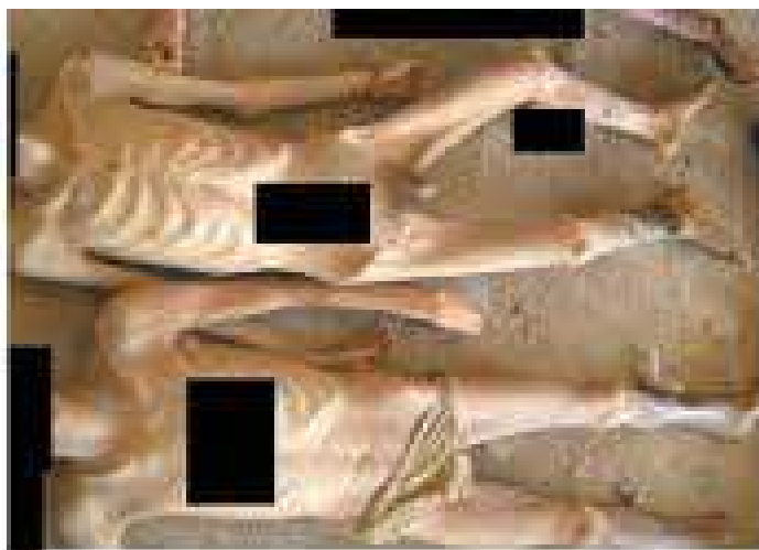
Figure 2 - Emaciated condition of two sets of remains. Note also the degree of ulceration and discolouration of the shin and ankle regions.

En un informe, se analizaron miles de fotografías del Gobierno sirio y archivos que contiene información de la muerte de personas apresadas desde marzo hasta agosto de 2011.