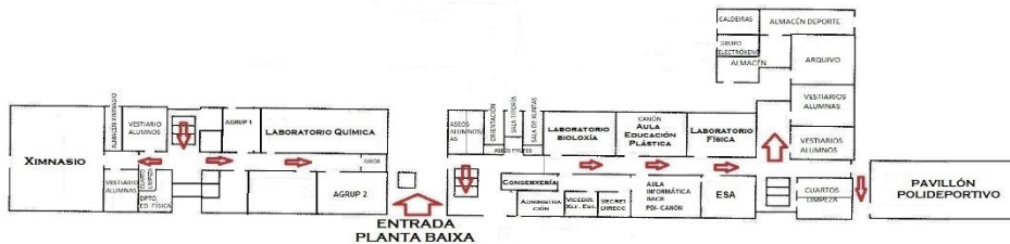
(a) O plano do IES Terra de Soneira.