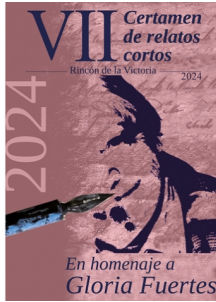
Certame de Relatos Curtos