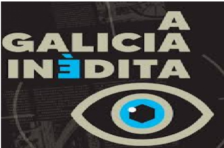
Exposición 'A Galicia inédita'