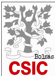
Bolsas de investigación no CSIC