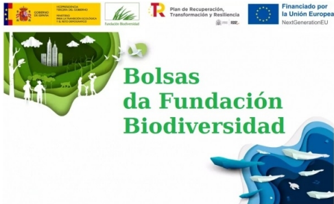
Bolsas da Fundación Biodiversidad