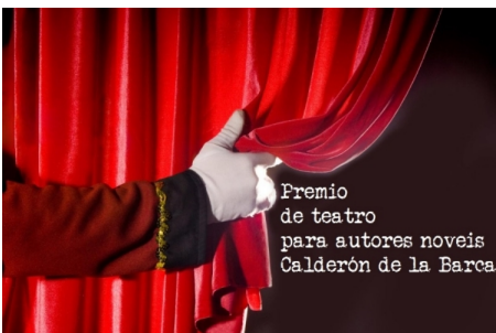
Premio de Teatro para Autores Noveis "Calderón de la Barca"