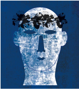
XXIII Mostra de Teatro Universitario de Galicia