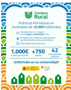
Programa Campus Rural. Prácticas universitarias en entornos rurais