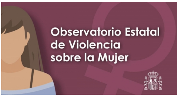
Bolsas do Observatorio Estatal de Violencia sobre a Muller