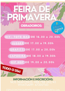
Feira da Primavera no Espazo Xove de Ourense