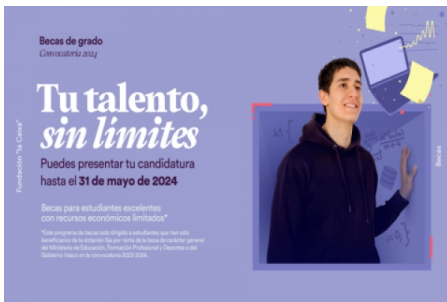
Bolsas Fundación la Caixa