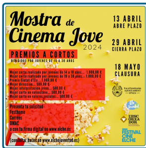
Mostra de Cinema Jove d´Elx