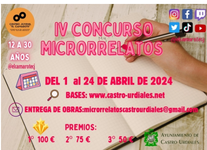
Concurso de Microrrelatos para mozos de 12 a 30 anos