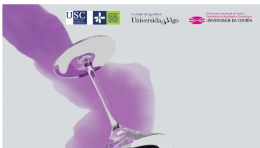
II Xornada Universitaria Galega 'Submisión química e violencias sexuais'