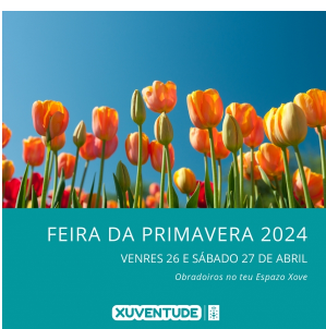
Feira da primavera en Lalín