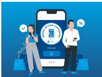
Bonos Activa comercio