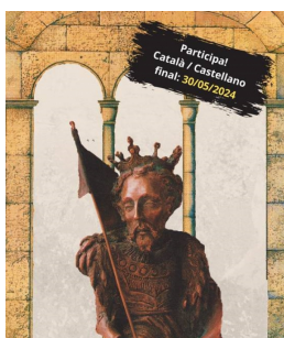
Premio Literario Jaime I

XIII PROXECTO DIDÁCTICO ANTONIO FRAGUAS FRAGUAS