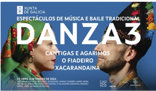
12º Edición "DANZA 3" 2024