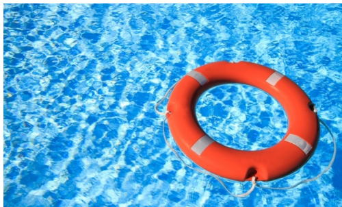
Cursos de socorrismo