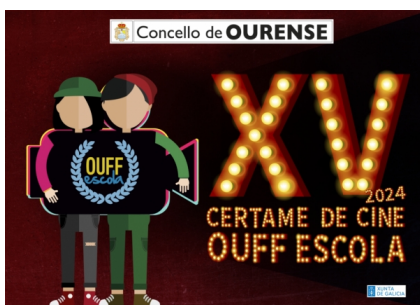
Certame de Cinema Internacional Ouff Escola