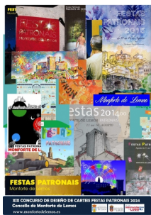
Cartel das festas de Monforte de Lemos