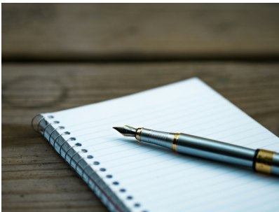
Certame Literario Villa de Ampudia