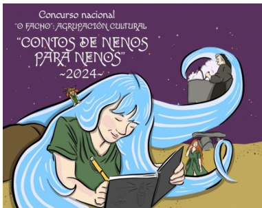
Concurso Nacional de "Contos de Nenos para Nenos"