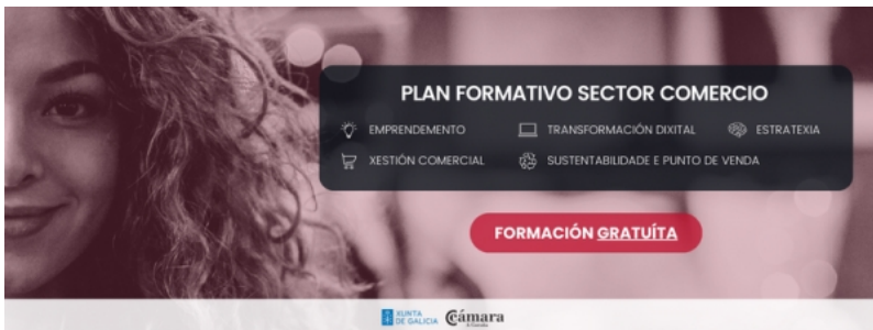
Cursos da Cámara de Comercio