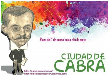
Concurso de Cómic Donaz