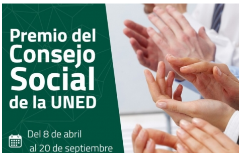
Premios Consejo Social UNED