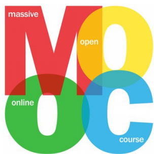
Cursos MOOC da UNED