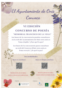
VI Edición do Concurso de Poesía "Memorial Francisco de la Vega"