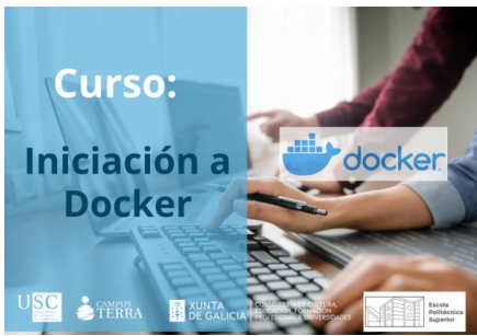
Curso de Iniciación a Docker na USC