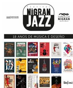
Cartel do XVIII Festival Nigranjazz