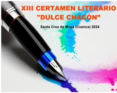
Certame Literario "Dulce Chacón"