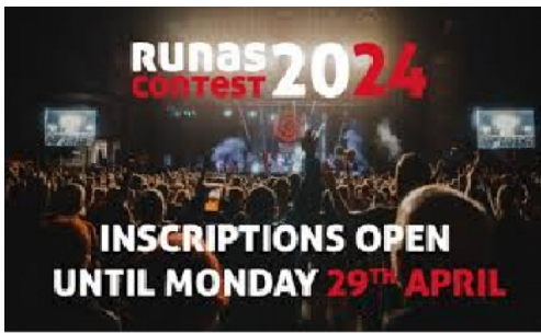
Concurso Runas 2024