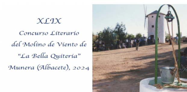
Concurso Literario Molino de Viento de la Bella Quiteria