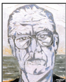
CONCURSO DE NARRATIVA XXXIII PREMIO LITERARIO CAMILO JOSÉ CELA