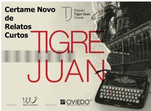
Certame Novo de Relatos Curtos "Tigre Juan"