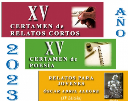
XV certame de relatos para mozos e mozas "Óscar Abril Alegre"