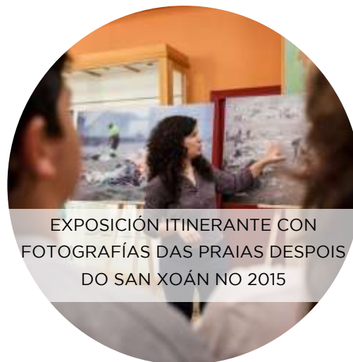
EXPOSICIÓN ITINERANTE CON FOTOGRAFÍAS DAS PRAIAS DESPOIS DO SAN XOÁN NO 2015