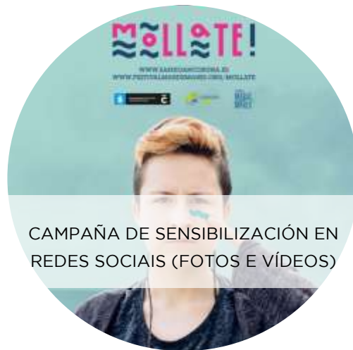
CAMPAÑA DE SENSIBILIZACIÓN EN REDES SOCIAIS (FOTOS E VÍDEOS)