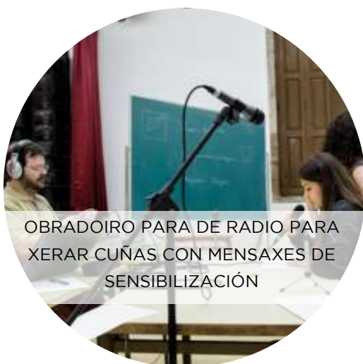
OBRADOIRO PARA DE RADIO PARA XERAR CUÑAS CON MENSAXES DE SENSIBILIZACIÓN