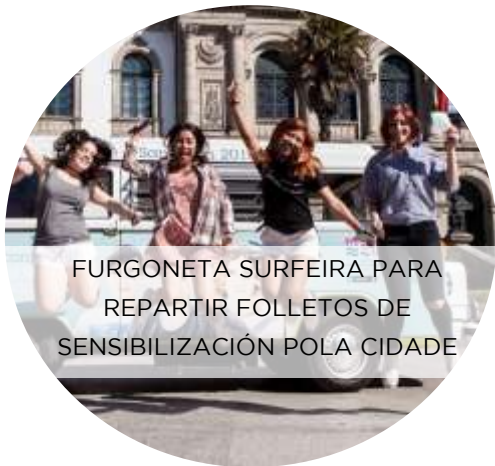
FURGONETA SURFEIRA PARA REPARTIR FOLLETOS DE SENSIBILIZACIÓN POLA CIDADE

No curso pasado, estas visitas á aula remataron cunha explosiva batería de ideas para concienciar á cidadanía da necesidade dun San Xoán sustentábel. De todas elas, cinco convertéronse en realidade co apoio da Concellaría de Medio Ambiente, participando o propio alumnado no seu deseño e execución!