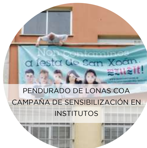
PENDURADO DE LONAS COA CAMPAÑA DE SENSIBILIZACIÓN EN INSTITUTOS