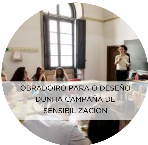
OBRADOIRO PARA O DESEÑO DUNHA CAMPAÑA DE SENSIBILIZACIÓN