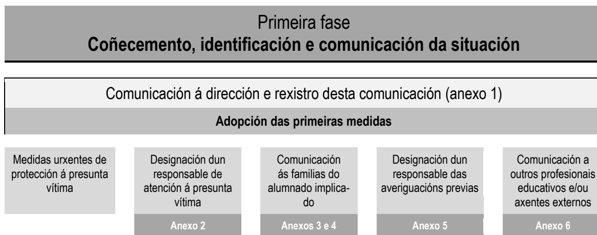
Cadro 1. Esquema da primeira fase do protocolo.

De apreciarse indicios de delito ou falta penal en calquera momento do proceso, notificarase ao ministerio fiscal e aos servizos de protección de menores (con traslado á administración educativa) para a súa valoración. No caso de iniciarse un proceso penal, o centro suspenderá as actuacións en tanto este non se resolva.