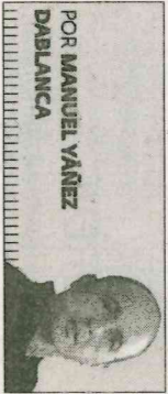
POR MANUEL VÁZQUEZ DABALCA

A preocupación polo clima é xa unha cuestión que transcende o ámbito social e político, e que se incardina con actualidade no entramado educativo. Estas consideracións partiron dos científicos, que son os que novedosamente, puxeron en garda aos poderes públicos polo uso irresponsable dos recursos naturais e polo consumo indiscriminado de combustibles fósiles. Pode que nunca antes un movemento de masas se estendera de forma tan rápida por todas as capas da sociedade.