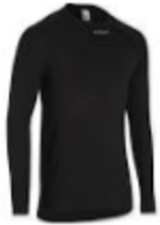
camiseta térmica manga larga...