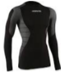
Camiseta térmica transpirable...