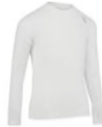
camiseta termica de esquí SIMP...