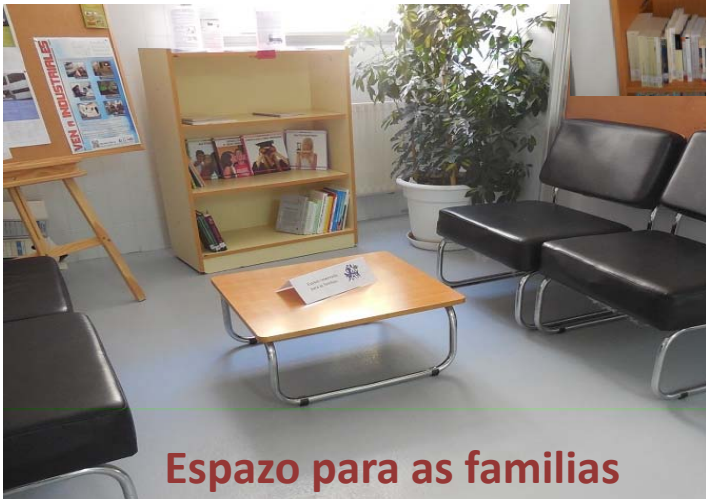
Espazo para as familias