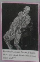
Carlos Casares, 1996, portada de Deus sentado nun sillón azul.