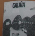
DEUS SENTADO NUN SILLÓN AZUL