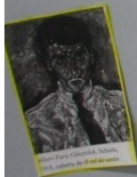
Carlos Casares, 1975, ilustración de Pablo Casares.

1974: Aprobada as oposicións e consegue plaza en Gal.