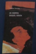
Os hortos daquel verán (1987)