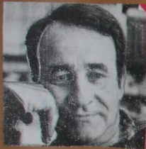
- CARLOS CASARES

Nascu en Xinezo de Limia (Ourense) o 24 de agosto de 1944 e faleceu en Vigo (Pontevedra) o 9 de marzo de 2002. Escritor e político.