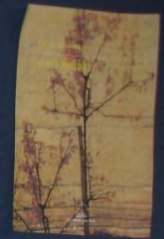
Vento ferido (1966)

Naceu en Ourense (Xirzo de Limia) o 24 de agosto de 1941 e morreu en Vigo (Miguñán) o 9 de marzo de 2002. Foi un importante escritor galego no que