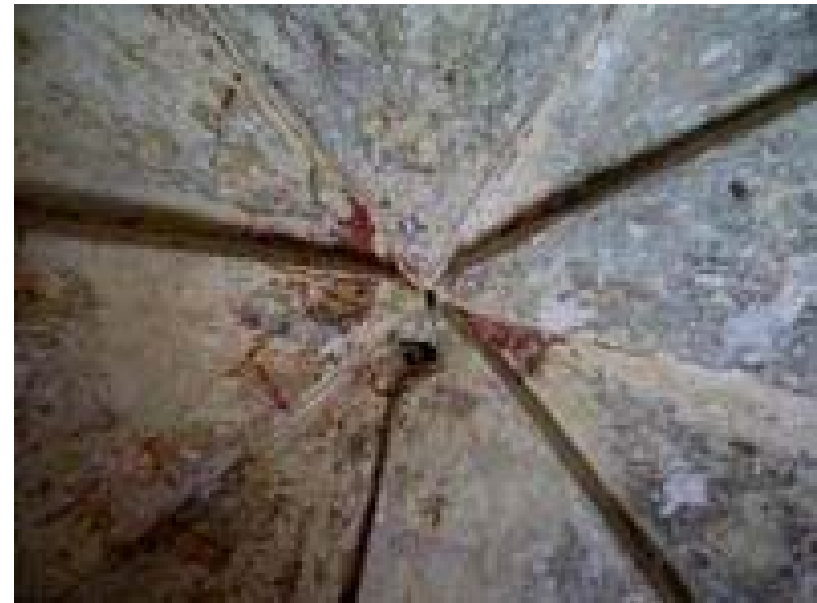
Ábsida: bóveda gallonada