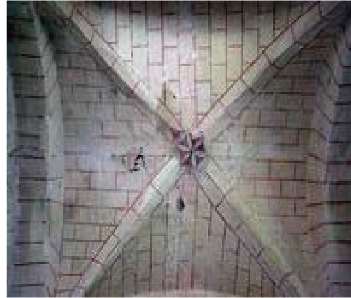
Cruceiro: bóveda de arestas