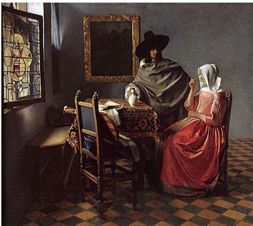
La copa de vino, 1658-1660, Johannes Vermeer