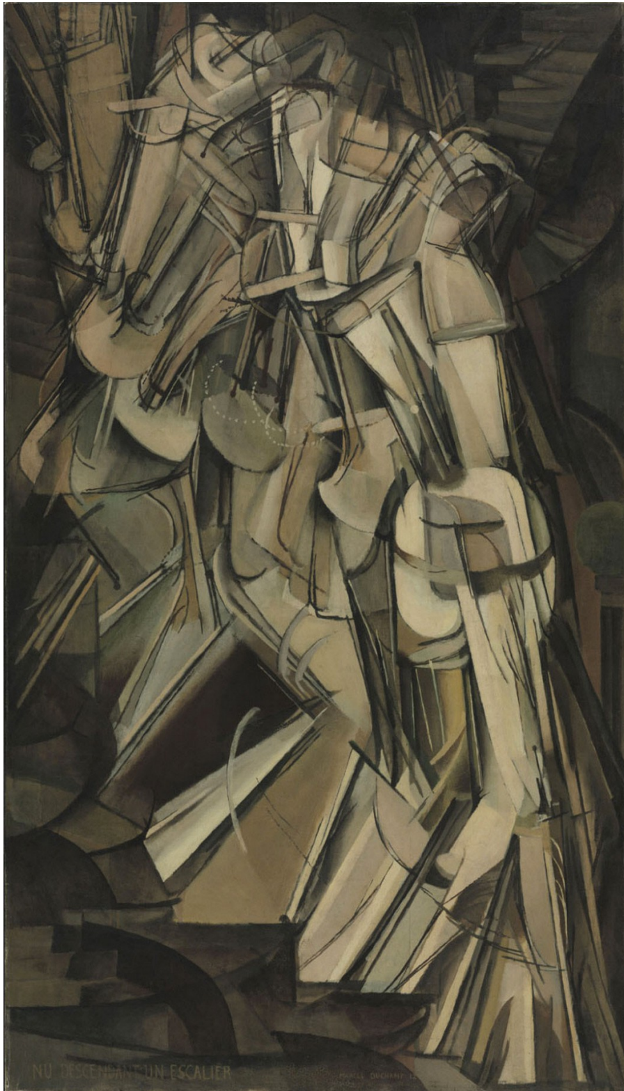
Con técnica libre realizar una interpretación de la obra de M. Duchamp, Desnudo bajando una escalera