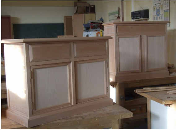
Mobles de madeira