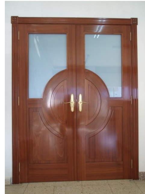
Fabricación e instalación de porta de dúas follas