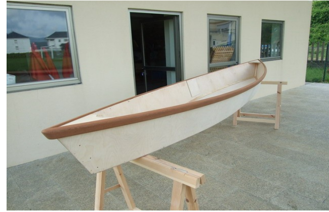
Embarcación de madeira