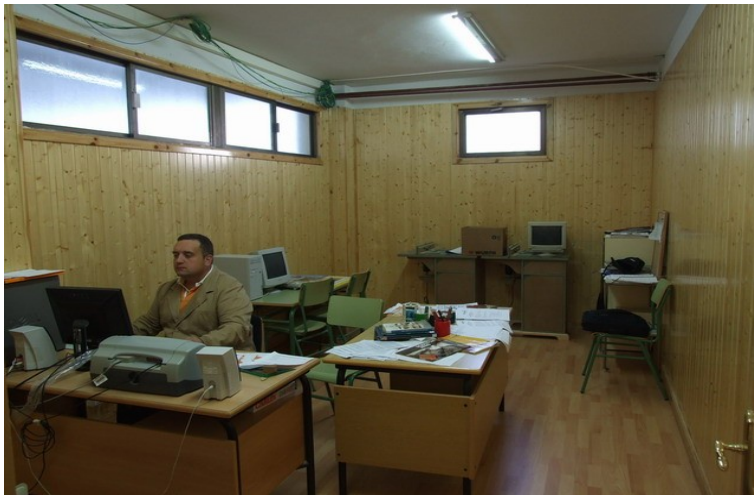
Acondicionamento aula técnica