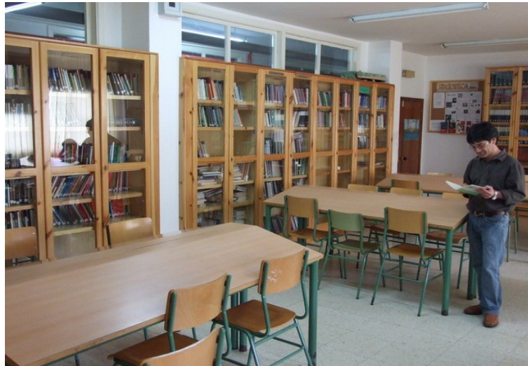
Mobles da biblioteca