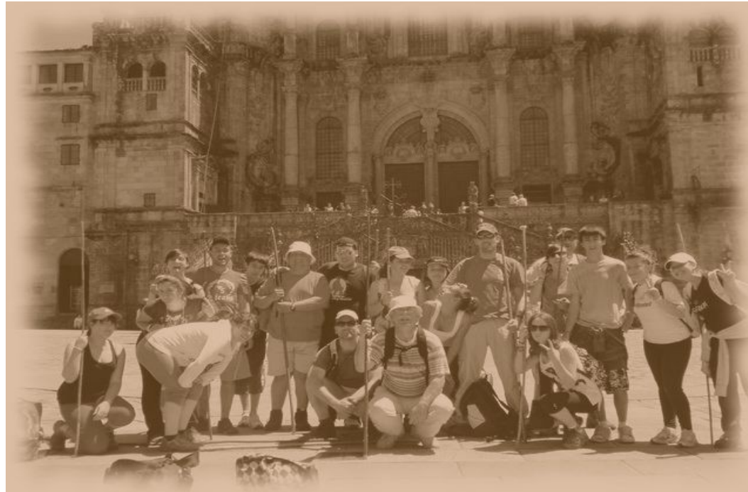
Camiño Inglés a Santiago de Compostela