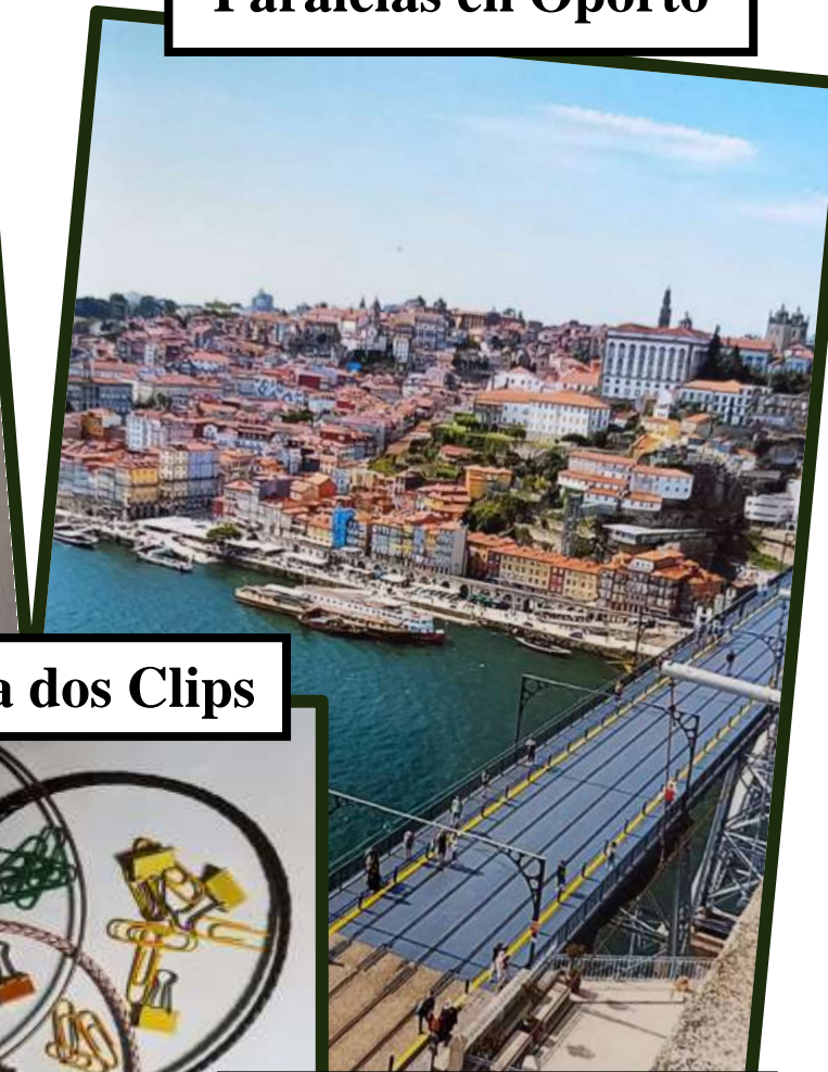
Diagrama dos Clips