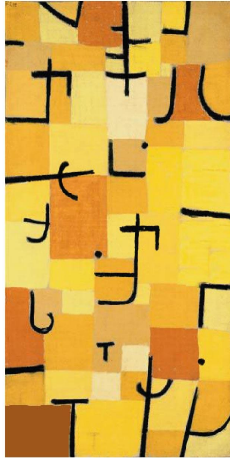
Paul Klee Caracteres en amarillo 1937