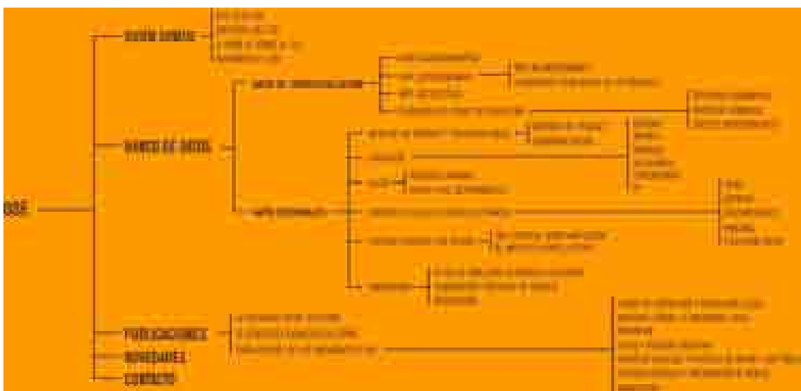
Imagen del mapa del website del OSE