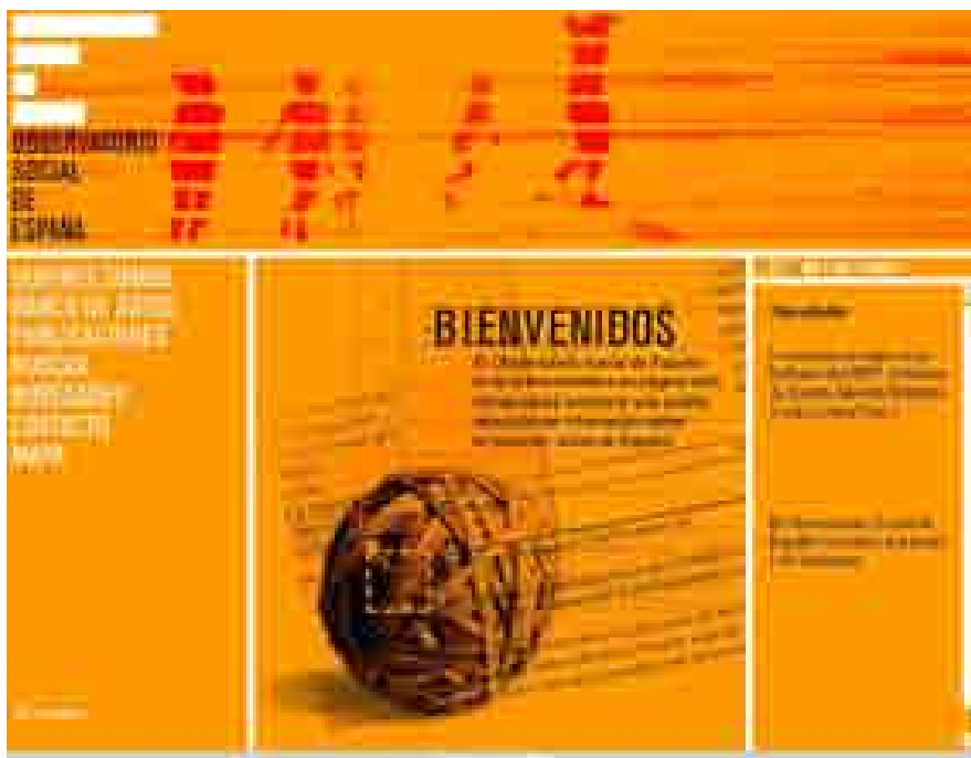
Imagen de la página de inicio del website del OSE

Se pretende ofrecer información actualizada y de fácil acceso y comprensión, tanto desde el punto de vista del idioma, dado que todos los contenidos son presentados en castellano, como del punto de vista de la interpretación, ofreciendo explicaciones y aclaraciones allí donde sea necesario. Los contenidos están organizados de manera que pretende optimizar su localización y agilizar su obtención, de manera que para todos los públicos sean utilizables de forma fácil y rápida. El sitio web se distribuye en siete secciones: