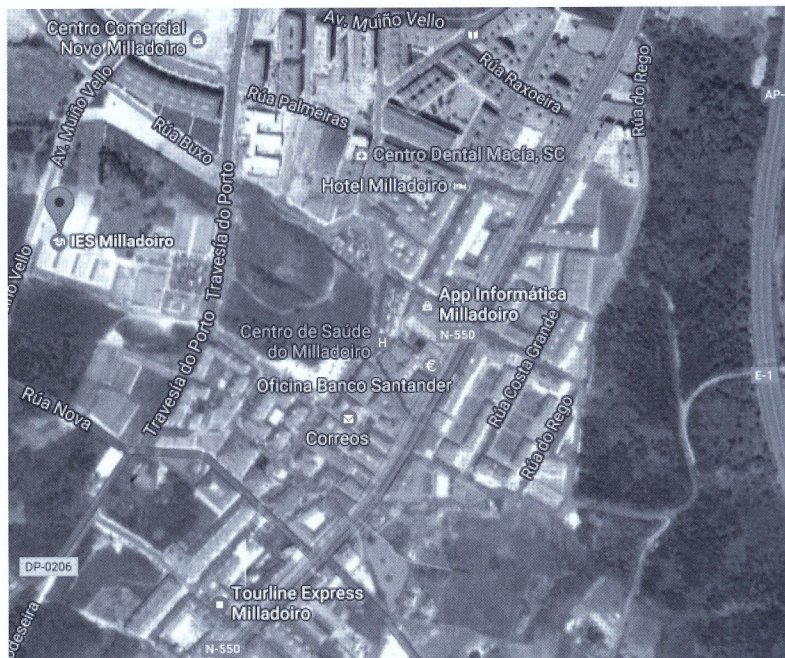
Localización do IES de O Milladoiro. Ausencia na vila de zonas verdes planificadas.

No IES Sánchez Cantón da cidade de Pontevedra impártese a materia de Paisaxe e Sustentabilidade en 2º da ESO. Acudimos ao centro en varias sesións para coñecer a dinámica do grupo observado e seguimos a traxectoria da materia a