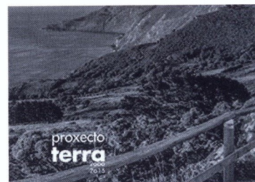
Materiais de secundaria do Proxectoterra: PAGUS: Galicia, un país de paisaxes.

tidade Territorial, pendentos dunha revisión que actualice actividades e contidos, sentaron as bases para a creación de novas materias para tratar a paisaxe de maneira interdisciplinar. Sobre esta base ofrécense