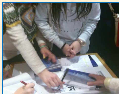
Imaxe do noso alumnado, agora escritores e escritoras, asinando libros despois da presentación.