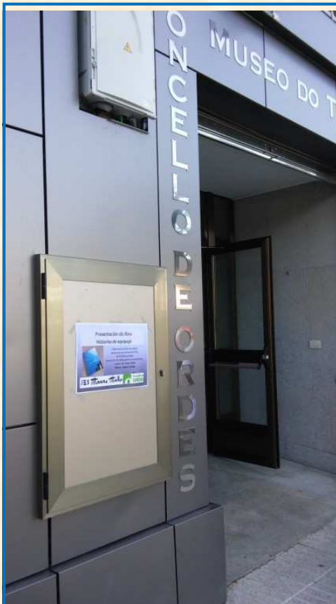
Cartel que anunciaba a obra á entrada do museo.

PUBLICACIÓN DUN LIBRO (coa temática das viaxes) escrito por alumnado de 4º da ESO baixo o título de Historias de equipaje . Como calquera obra que se precie tivo un momento para a súa presentación. Fíxose no Museo do Traxe Juanjo Liñares de Ordes o día 1 de xuño de 2015, ás 20 horas.