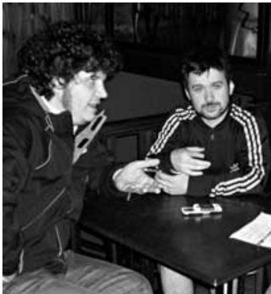
Touriñán e Pereiro son a outra cara de Mucha e Nucha | ÁLVARO NOYA

—Imaxinabades que iades colleitar tanto éxito?