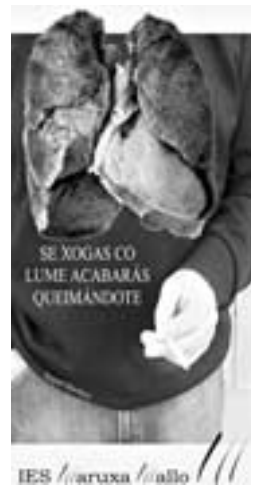
IES Maruxa Mallo

Pódese mirar para outro lado e pensar na crise como problema duns poucos desafortunados pero, certamente, as grandes diferenzas de economías entre cidadáns é máis preocupante e, quizais, a crise é unha consecuencia disto. Ou unha delas.