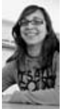
Eva di que lle gustaría repetir a experiencia

—Sentínme importante [ri]. Pensaba que as persoas que son moito máis coñecidas ían ser bordes por estar cansos da xente e levei unha agradable sorpresa.