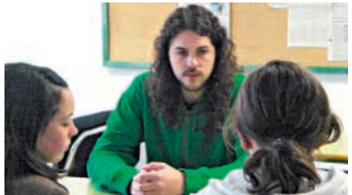
Mou cuida da súa imaxe, aínda que os «melenudos» tamén poden ser artistas | TAMARA VEIRAS

—Si. Antes facíamolo máis ben en plan broma, pero agora facémolo en serio. Ao