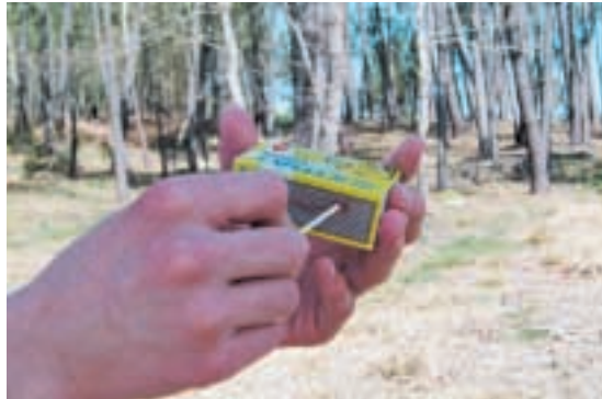
A maior parte dos lumes son provocados polo home

Nese tráxico mes ardeu o 3,81% do espazo forestal de Galicia e a