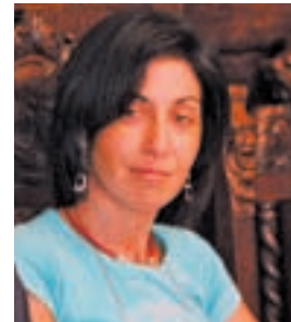
Couto foi a primeira muller en presentarse a alcaldesa de Ordes | P.R.

se o modo no que se realiza o orzamento das campañas electorais en España; pero ser, son necesarias, como necesaria é a política por máis que sexa moi criticada.