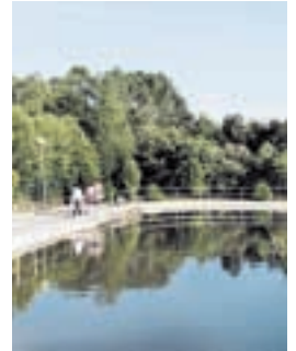
Vista do río Mercurín

O goberno de Ordes emprendeu accións legais contra