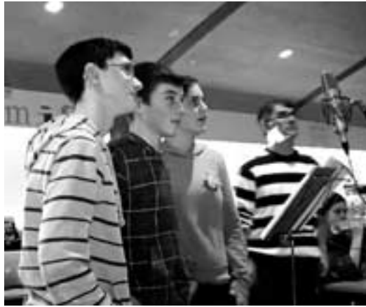
Os alumnos comprobaron o difícil que é este traballo | L. MANTEIGA

Ao volver do recreo, proseguimos coa actividade, pero desta vez o que nos ensinaron foi como funcionaba todo no instante da gravación, aí foi cando tiveron que intervir os téc-