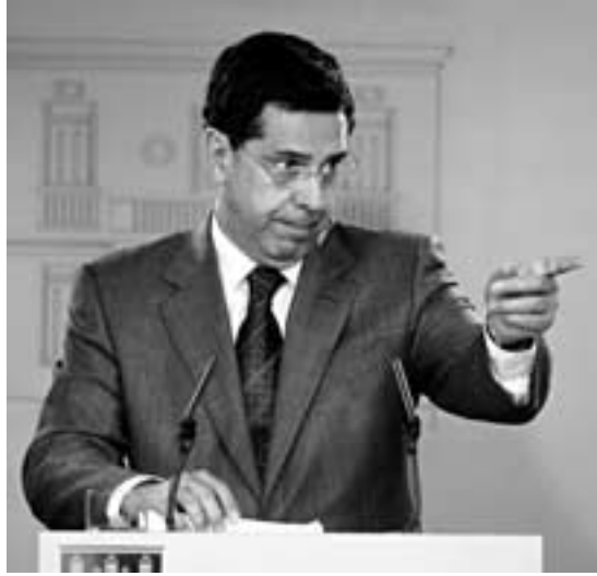
Moraleda aposta pola boa xestión e manexo das explotacións

—Moi sinxelo, cantos máis, mellor. Como principio xeral e fundamental a produción ecolóxica proclama a preservación da biodiversidade, o mantemento ou