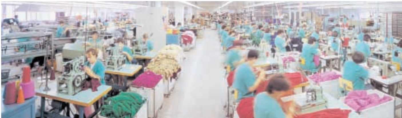
Viriato, radicada en Ordes, é unha das grandes empresas do sector téxtil galego e os seus produtos teñen proxección en multitude de mercados | TAMARA VEIRAS

Galicia é a principal exportadora de prendas de España, por diante de Cataluña ou Valencia