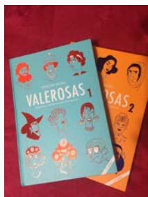
Valerosas 1 y 2