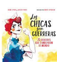
22 mujeres guerreras

Neste mes de marzo a temática, posto que este 8 de marzo está convocada a 1ª folga feminista, será a literatura escrita por mulleres, aínda que estas se agocharan en pseudónimos masculinos. Ofrecémosche algúns títulos, pero podes escoller o que ti queiras, sempre que fose escrito por unha muller.