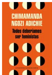
Todas deberíamos ser feministas