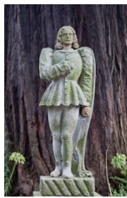
Macías o Namorado