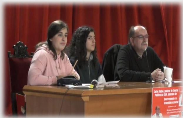
Carlos Taibo, teórico do Decrecemento no Salón de Actos do Lucus

Para min é esencial mostrar este tipo de movementos, para facer ver á humanidade que a situación que estamos a vivir é completamente agonizante e inadecuada. Claramente é difícil acabar co capitalismo, xa que ven dado por uns gobernos, que ademais nós mesmos eliximos, polo que somos igual de culpábeis. Así, ten que vir da nosa parte todos estes remedios porque, como se di no gran filme Fight Club de David Fincher: “ as cousas que posees rematan sendo donas de ti (...) só despois de que perdes todo é o momento no que es libre para facer calquera cousa”.