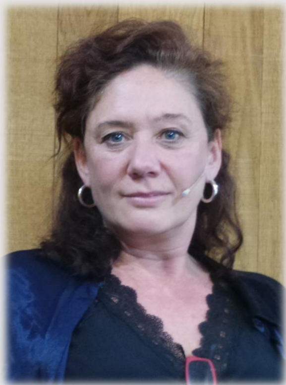
Cristina Fallarás (Wikipedia)

sociais evolucionou ata tal punto que nos unen e iso é clave á hora de entender o éxito dos últimos 8M. E paralelamente están a crear un relato machista violento que sae á rúa. A min ás veces insúltanme pola rúa, empúxanme ou me cospen. Ata me tentaron pegar. Ese relato vén de pasar o relato das redes á rúa.