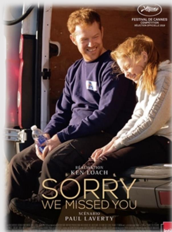
Cartel de Sorry We Missed You.

A película "Sorry we missed you", do director Ken Loach reflicte unha realidade que vai máis aló do capitalismo salvaxe e o seu "neoescravismo", representado por un pai de familia de clase obreira, que traballa coma un falso autónomo servindo a unha empresa de paquetería e unha nai que coida a anciáns e enfermos. Ambos os dous traballan baixo unhas condicións de precariedade extrema a cambio duns soldos que apenas lles dan para subsistir. Deste xeito, viven para traballar, sendo vítimas directas das prácticas