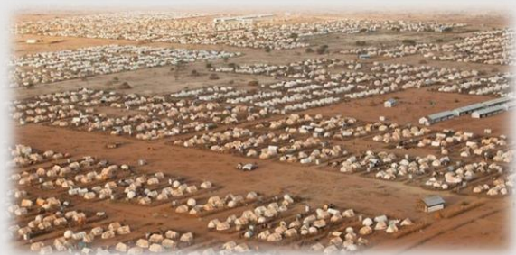
Campamento de Dadaab, Kenia.

Aínda que as causas varían, o número de persoas desprazadas segue en aumento, sendo a primeira metade do ano 2017 o período con maior éxodo xamais rexistrado, con máis de 70 millóns de persoas, ascendendo a 24,4 millóns o número de refuxiados, segundo os datos do Alto Comisionado das Nacións Unidas para os Refuxiados (ACNUR).