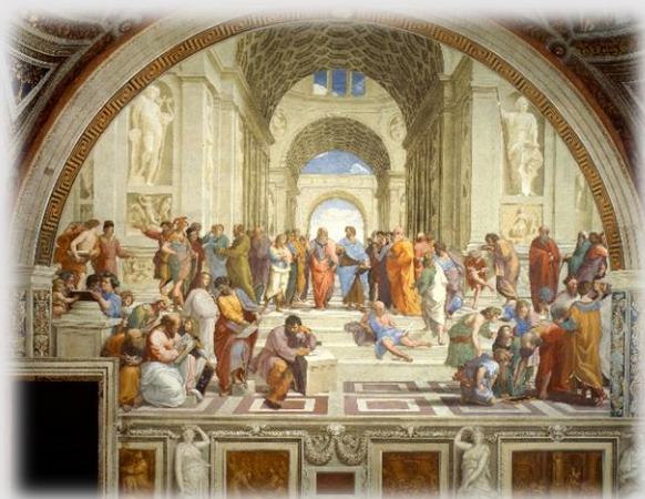
"A Escola de Atenas" de Rafael Sanzio

Por añadidura, sus razonamientos llevan a profundas incoherencias una vez los ponemos en práctica. Desde niños, se nos inculca, incluso bajo severas amenazas, la obligación de no mentir nunca para, inmediatamente después, censurar todo aquello que pueda resultar incómodo en público.