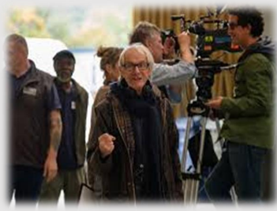
O director Ken Loach na gravación.

As relacións laborais que este ofrece son perfectamente descritibles a través dos ollos do teórico Marx. Este vén a dicir que os traballadores semellan ser máquinas que funcionan grazas á graxa que os move, é dicir, un salario. Pero iso non significa que os salarios que estes reciben sexan xustos, de feito, non o son. Aquí de novo a figura do gran patrón e do capitalismo volve ser imprescindible, xa que o sistema calcula o salario a partir da plusvalía que espera recibir. Isto é, se buscamos unha produción en cadea e custos mínimos posibles, pero chegamos a un punto onde os custos non poden ser máis baixos, baixar os salarios dos traballadores fai que non deixen de aumentar as súas respectivas plusvalías. Entón, a necesidade das persoas por sacar adiante un diñeiro que permita manterse, coma no caso da parella da película, fai que traballar nestas condicións sexa case unha imposición. Por iso, a historia sempre é a mesma e sempre tende a repetirse.