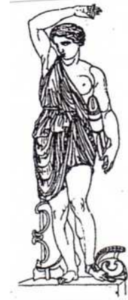
Se decía que las guerreras Amazonas se cortaban el pecho derecho para que no les estorbara al manejar el arco

S O L M J A J A B A L I O D A M A Z O N A S T C E M L I E S R A C E G E N E R A K O U A U J F S U S P U N Z M M J C H E S C I E R V A M H E O E I E D R A Z Z C B I C D Z R D S E D I R E P S E H E B B O T M I W Q E U I S Ñ S T E R I Y O G I T R I V J O I R S N D G J M A U G I A S N O X F X E V B N I E B L A M R A A Ñ N E M E A R O I F O E T L L E C X A L I B O R T O R O A W F P O F O T Z E X C A M B E S A B O N I L P