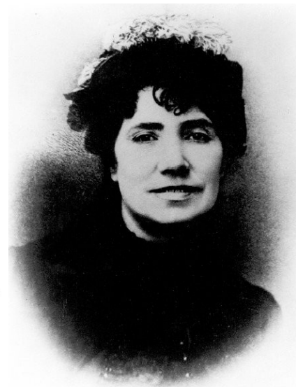
Imaxe de Rosalía de Castro.