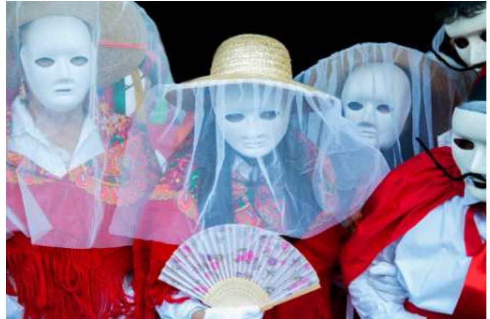
Madamitas e madamitos de entrimo