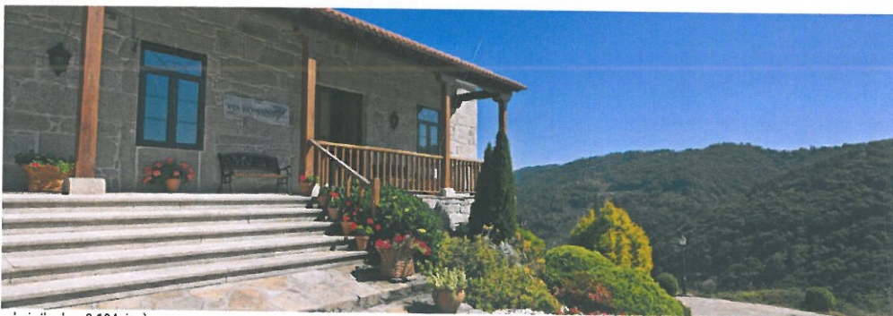
View of the building entrance