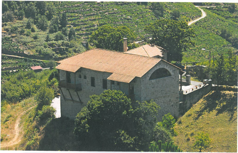
View of the building from the hillside