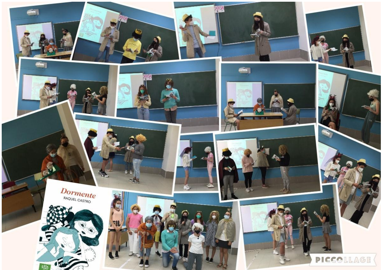
Encontro coa escritora, Raquel Castro