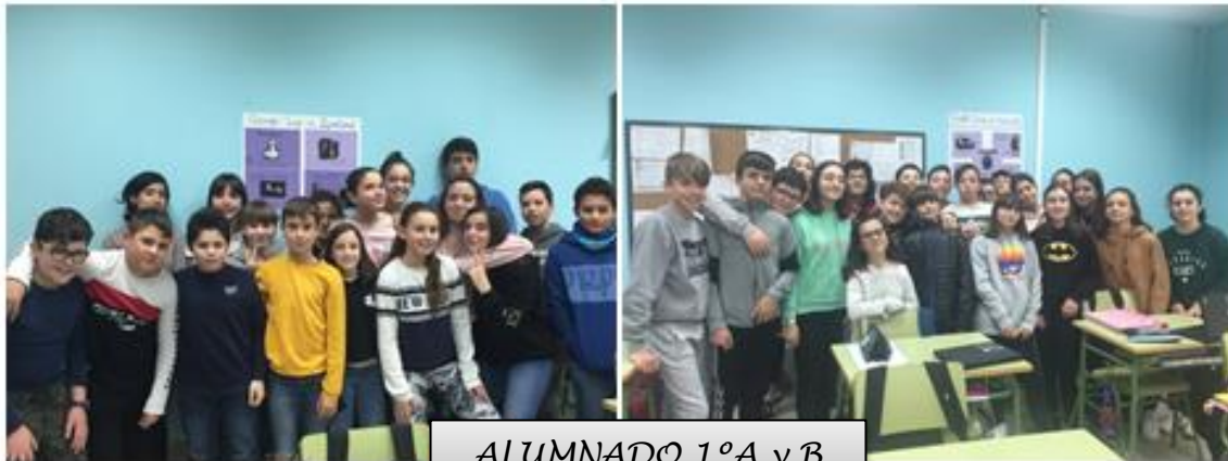
ALUMNADO 1ºA y B