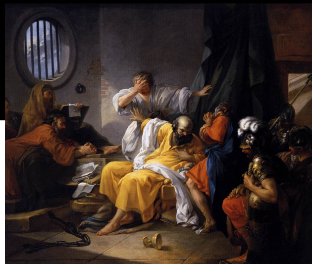
A MORTE DE SÓCRATES, ÓLEO DE JACQUES LOUIS DAVID (1787) NEW YORK, METROPOLITAN MUSEUM OF ART

-Agora sabemos que non sabemos realmente?