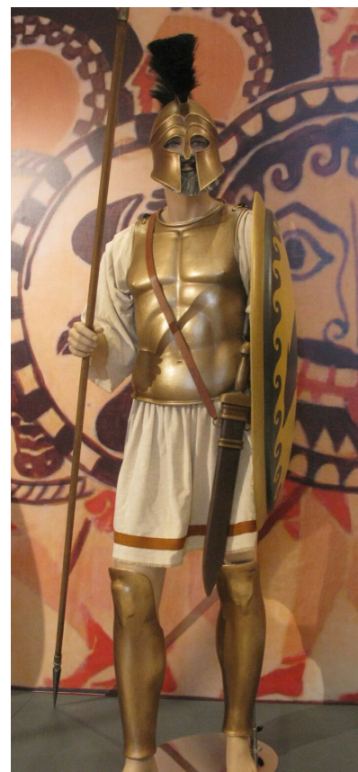
A SÓCRATES FOI UN SOLDADO HOPLITA DE RECONECIDO VALOR QUE TIVO QUE LOITAR DURANTE VINTESETE ANOS NAS FILAS DA INFANTERÍA ATENIENSE. ÉSTA É A RECONSTRUCCIÓN DUN HOPLITA ATENIENSE DA ÉPOCA.