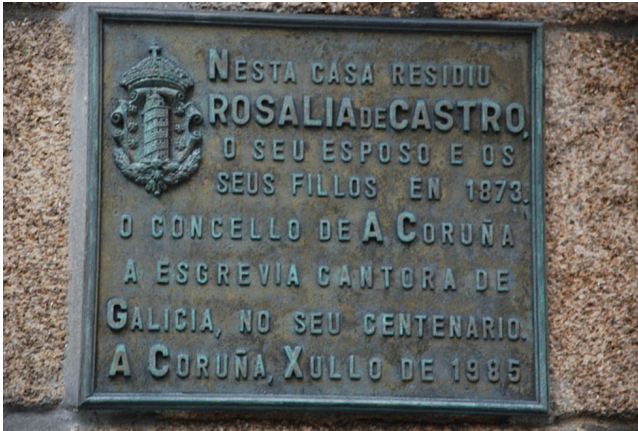
FOTO 7: Na rúa Príncipe, na casa de Rosalía de Castro e Manuel Murguía

Rosalía de Castro non precisa presentación. Porén, poderías explicar o seu papel na denuncia da situación das mulleres na súa época? Busca algúns poemas que amosen a súa faceta máis reivindicativa neste sentido.