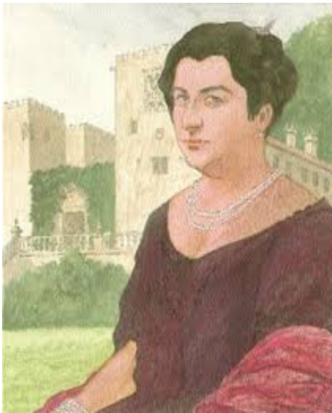
FOTO 4: Na rúa Tabernas 11, na casa de Emilia Pardo Bazán e sede da RAG

Cal son as obras máis coñecidas desta escritora?